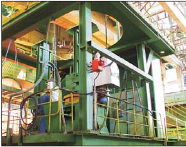
TR 54 auf Pfannendrehturm TR 54 on ladle turn table