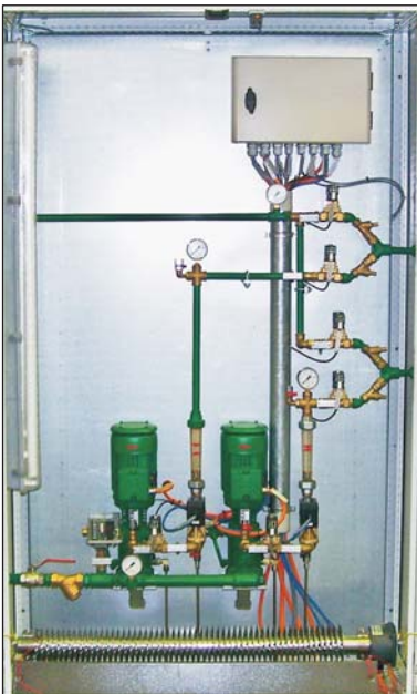
Armaturenschrank für die Wasserfernverstellung Fittings cabinet for water distance adjustment