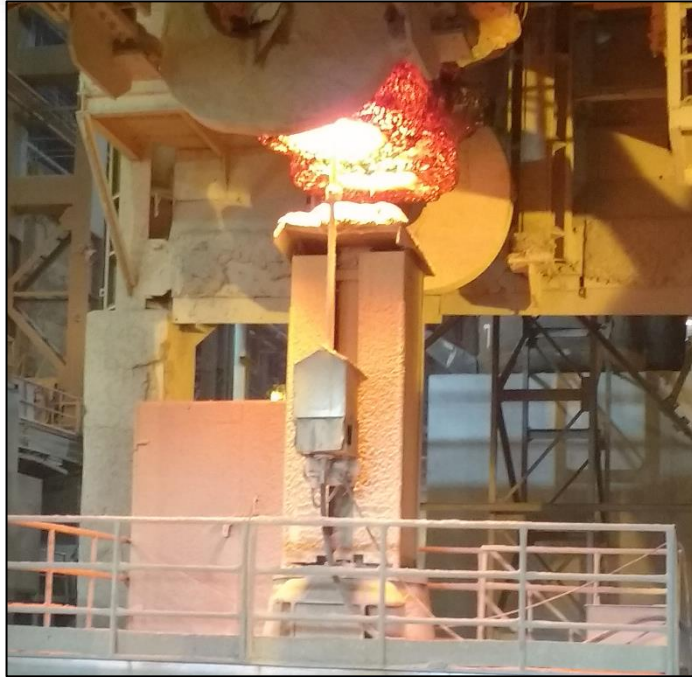
Spritzmanipulator TR54 Gunning manipulator TR54