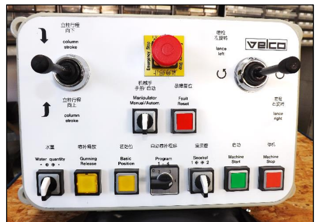
Fernsteuerung Remote Control