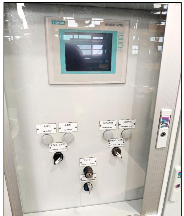
Bedienfeld: Siemens Touchpad Operator Panel: Siemens Touchpad