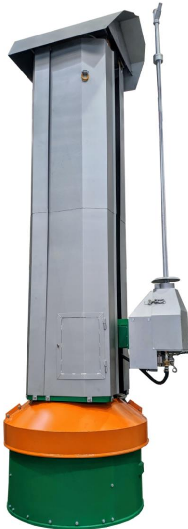
Spritzmanipulator TR54 mit 1 Lanze Gunning manipulator TR54 with 1 Lance