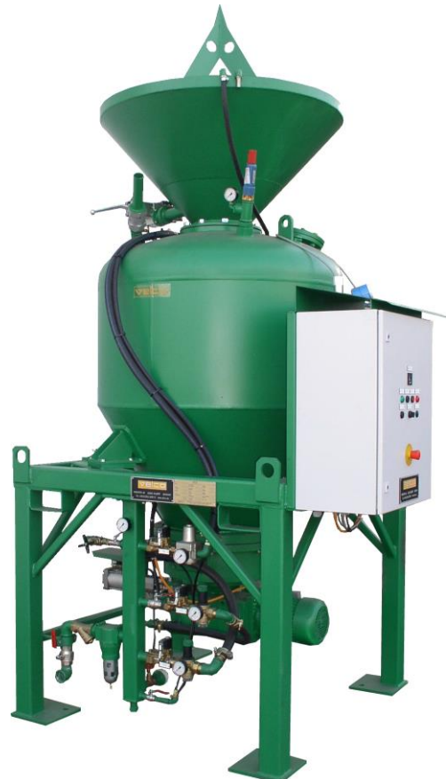
Spritzmaschine EKS-K Gunning machine EKS-K